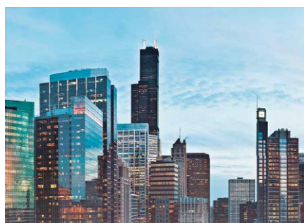
Commercial Product Line Water-Source Heat Pumps